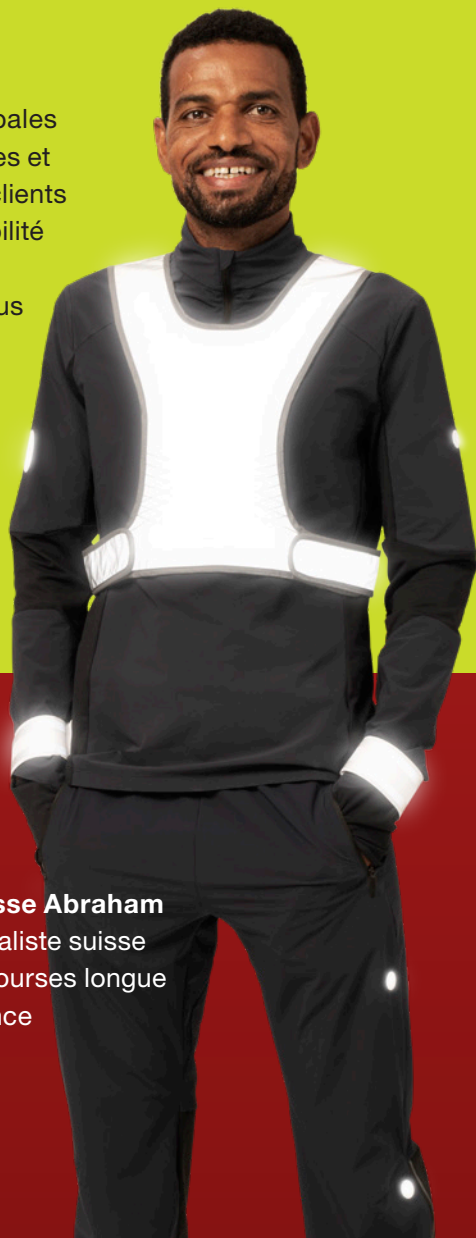
Tadesse Abraham Spécialiste suisse des courses longue distance

Vous trouverez d'autres conseils et informations sur : leslumieres.ch